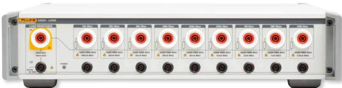
Дополнительное устройство высокоомной нагрузки 5322A-LOAD