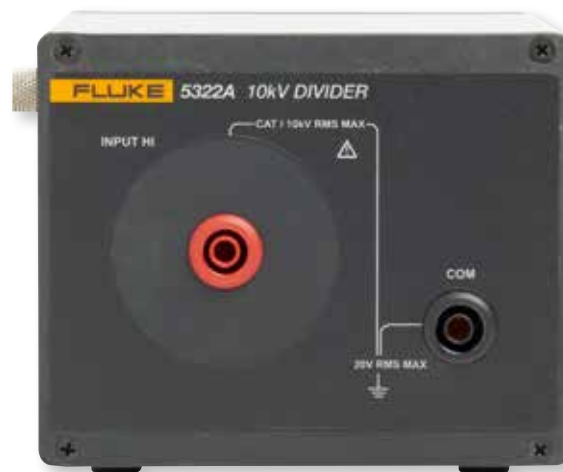
Прибор 5322A оснащен внешним делителем 10 кВ, который позволяет измерять параметры тестеров с выходами 10 кВ.

Среди большого диапазона моделей вы можете выбрать подходящий прибор, который соответствует вашему оборудованию и бюджету.