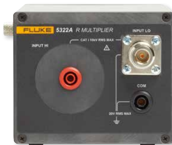
Каждый прибор 5322A поставляется с внешним умножителем сопротивления, который обеспечивает сопротивление до 10 ТОм для проверки тестеров сопротивления изоляции.