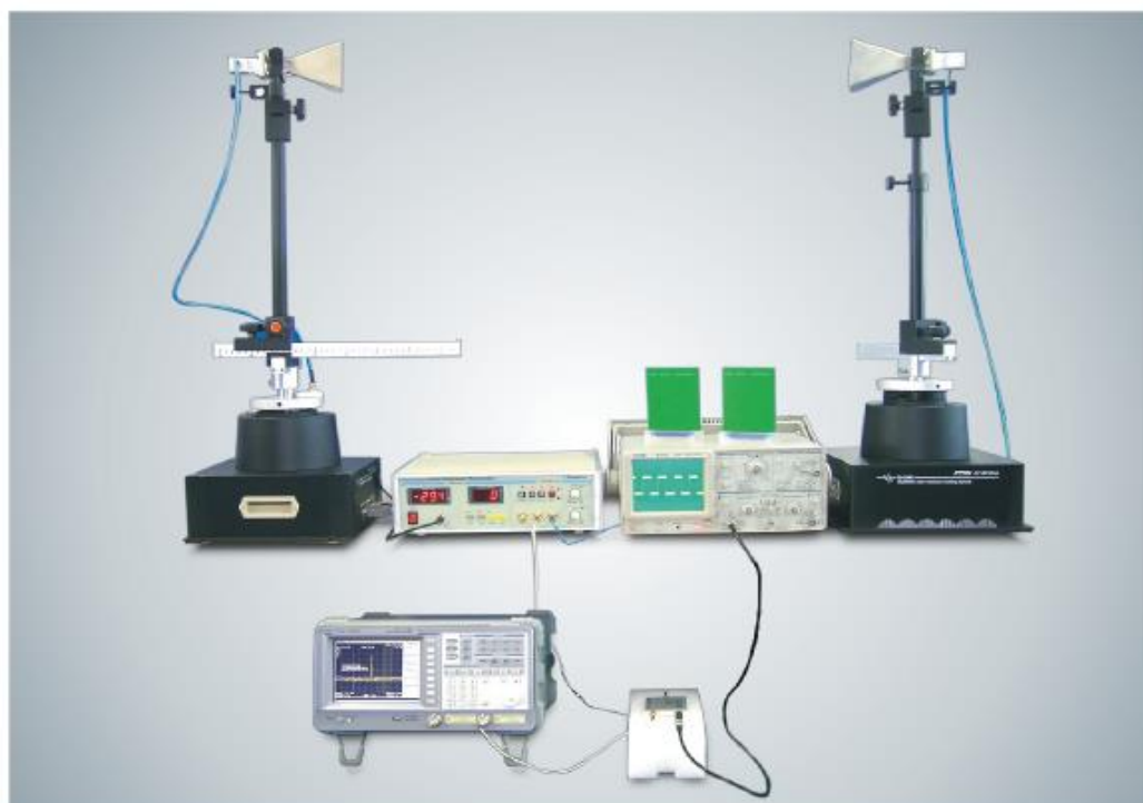
Типовая схема подключения элементов обучающего комплекта (антенны, устр-ва юстировки, кабели, контроллер-измеритель) и внешних средств измерений (анализатор спектра, осциллограф) для выполнения практических опытов