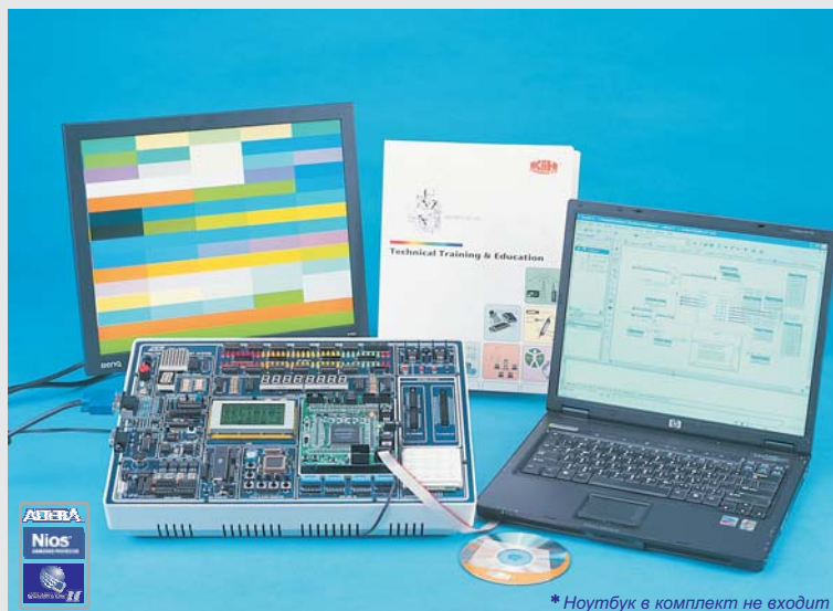
* Ноутбук в комплект не входит

Учебная система CIC-560 построена с использованием новейшей цифровой технологии на базе учебного материала по экспериментам с кожногальванической реакцией. Эта учебная система состоит из микросхемы FPGA с логическими элементами высокой степени интеграции и большим числом выводов. Поэтому студенты могут составлять, реализовывать и проверять простые и более сложные цифровые схемы, устройства цифровой обработки сигналов и ЦПУ/МСУ.