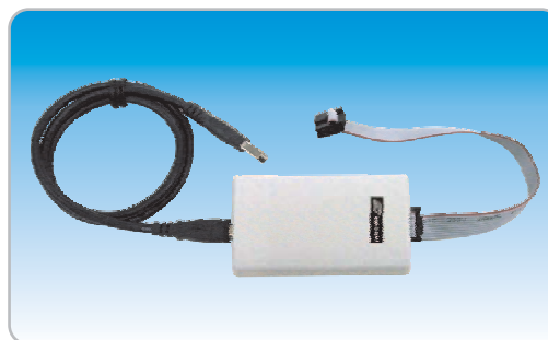
CIC-560-BL Программатор USB