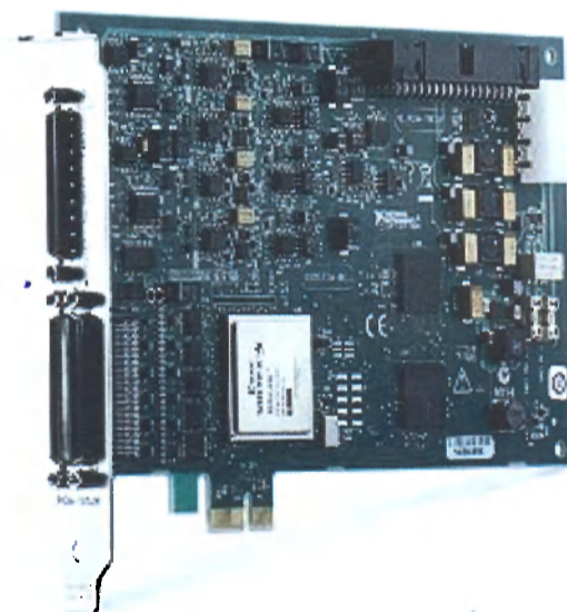
общий вид с интерфейсом PCIe

По условиям эксплуатации преобразователи напряжения измерительные аналого-цифровые и цифро-аналоговые модульные NI 7841R, NI 7842R, NI 7851R, NI 7852R, NI 7854R соответствуют группе 3 ГОСТ 22261-94.