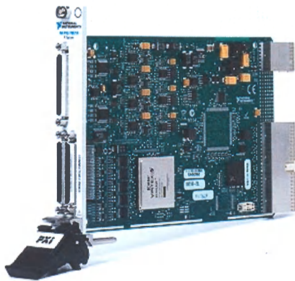
общий вид с интерфейсом PXIe

Внешний вид показан на фотографиях ниже.